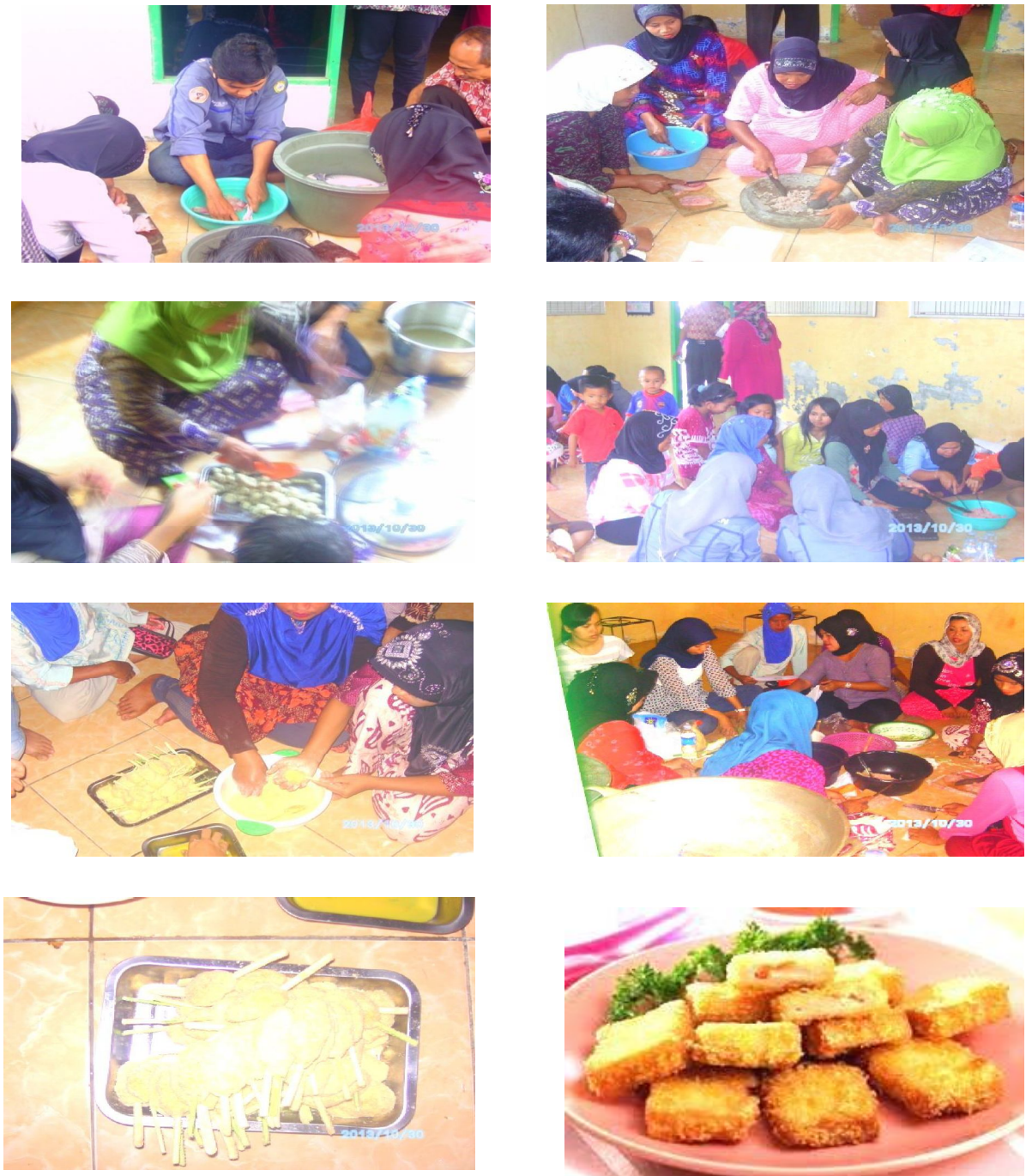
Gambar 2. Aktivitas khalayak sasaran dalam pelatihan keterampilan pengolahan ikan patin