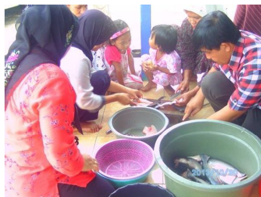
Gbr. 1. Teknis penyanganan ikan

Secara teknis, konsep program pembinaan masyarakat di Desa Jingah Habang Hilir yang telah dilaksanakan dalam bentuk secara berkelompok yang sesuai dengan kepribadian dan karakternya, kemudian ditawarkan, disepakati dan akhirnya menghasilkan suatu panduan praktis pelatihan produk pangan ikani siap saji (bakso, nugget, dan kaki naga berbasis ikan patin).